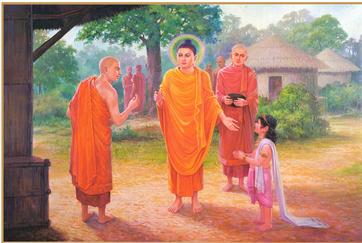
38. Con vua thì kế nghiệp cha

câu chuyện của sa di Rāhula trở thành hình ảnh tiêu biểu cho sự giáo dục tinh thần đối với tuổi trẻ nhiều thế hệ cho tới ngày nay.